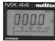
résistance inférieure à 0,5 ohm (ici : 0,0 ohm=continuité)

Si les mesures ne sont pas bonnes, remplacer le faisceau correspondant (fils, connecteurs).